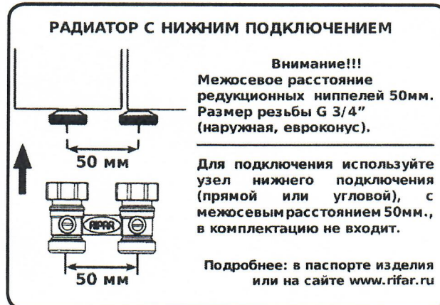
рис. 1 Дополнительный стикер

латунь 50 мм накидная гайка G 3/4" шаровый кран евроконус с прокладкой O-ring G 3/4" наружная резьба с евроконусом. прямое Италия